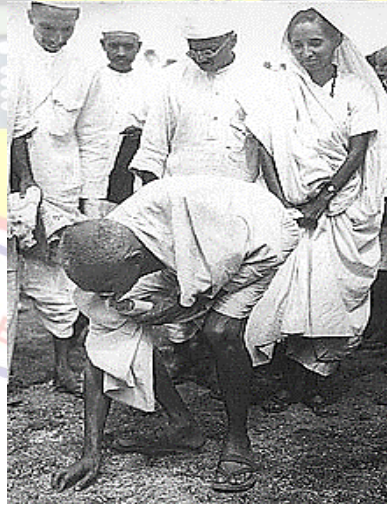
Figure 1 महात्मा गांधी दांडी येथे मिठ उचलतांना गांधीजी

१९२० च्या दशकाचा मोठा काळ गांधीजी प्रत्यक्ष राजकारणापासून दूर राहिले आणि त्यांनी आपले लक्ष स्वराज्य पक्ष आणि भारतीय राष्ट्रीय काँग्रेसमधील मतभेद दूर करण्यावर केंद्रित केले. या काळात त्यांनी समाजातील अस्पृश्यता, दारू समस्या आणि गरिबी कमी करण्याचे आपले प्रयत्न चालू ठेवले. राजकारणाच्या पटावर ते इ.स. १९२८ मध्ये परत आले. एक वर्ष आधी ब्रिटिश सरकारने संविधानात सुधारणा करण्यासाठी सर जॉन सायमन यांच्या अध्यक्षतेखाली एक समिती स्थापन केली होती. या समितीमध्ये एकपण भारतीय सदस्य नव्हता. या कारणाने भारतीय पक्षांनी या समितीवर बहिष्कार टाकला. गांधीजींनी १९२८ च्या कलकत्ता येथील काँग्रेसच्या अधिवेशनात एक ठराव पास केला. त्याद्वारे ब्रिटिश सरकारकडे भारताला सार्वभौम दर्जा देण्याची मागणी करण्यात आली व ही मागणी मंजूर न केल्यास परत पूर्ण स्वराज्यासाठी असहकार चळवळ सुरू करण्यात येईल असे बजावण्यात आले.