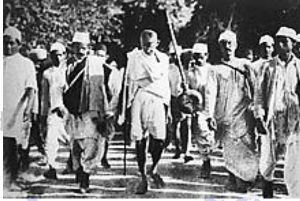
Figure 2 महात्मा गांधी दांडी यात्रेत

घोषणा केली आणि त्याची परिणती प्रसिद्ध दांडी यात्रेत झाली. १२ मार्चला अहमदाबादहून निघालेली यात्रा, ६ एप्रिलला ४०० कि.मी.चा (२५० मैल) प्रवास करून दांडीला पोहोचली. हजारोंच्या संख्येने भारतीय या यात्रेत सहभागी झाले होते. ही यात्रा इंग्रजांची भारतातील पाळेमुळे उखडण्याच्या प्रयत्नांमधील सर्वात यशस्वी प्रयत्न ठरली. ब्रिटिशांनी उत्तरादाखल ६०,०००हून अधिक लोकांना तुरुंगात डांबले.