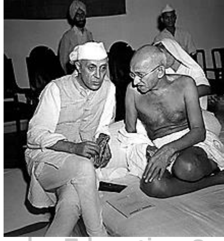
Figure 3 पंडित नेहरू आणि महात्मा गांधी. ८ ऑगस्ट १९४२. भारत छोडो आंदोलन. यानंतर लगेचच दुसरी दिवशी सकाळी गांधींना अटक करण्यात आली.

पक्षातील आणि इतरही काही नेत्यांनी गांधीजींवर टीका केली. यात ब्रिटिशांचे समर्थन करणारे तसेच त्यांना विरोध करणारे दोन्ही गट सामील होते. काहींना वाटले की इंग्रजांच्या जीवनमरणाच्या अशा या युद्धात त्यांना विरोध करणे अनैतिक होय तर काहींचे मत होते की गांधीजी मिळालेल्या संधीचा पूर्ण उपयोग करून घेत नाही आहेत. भारत छोडो चळवळ भारताच्या स्वातंत्र्यसंग्रामातील सर्वात प्रभावी चळवळ ठरली. यात लाखांच्या संख्येने लोकांना अटका झाल्या, अभूतपूर्व अत्याचार करण्यात आला. हजारो आंदोलक पोलिसांच्या गोळीबारात मरण पावले. गांधीजी आणि त्यांच्या सहकाऱ्यांनी हे स्पष्ट केले की भारताला तात्काळ स्वातंत्र्य दिल्याशिवाय भारत महायुद्धात मदत करणार नाही. गांधीजींनी हेसुद्धा स्पष्ट केले की यावेळेस एखाद-दुसऱ्या हिंसक घटनेमुळे ही चळवळ मागे घेण्यात येणार नाही. आवरात ठेवलेल्या अराजकतेपेक्षा खरी अराजकता बरी. असे सुचवून त्यांनी काँग्रेस सदस्यांना अहिंसेचे पालन करण्याचे आवाहन केले आणि भारतीयांना 'करो या मरो' (करा किंवा मरा) हा मूलमंत्र दिला.